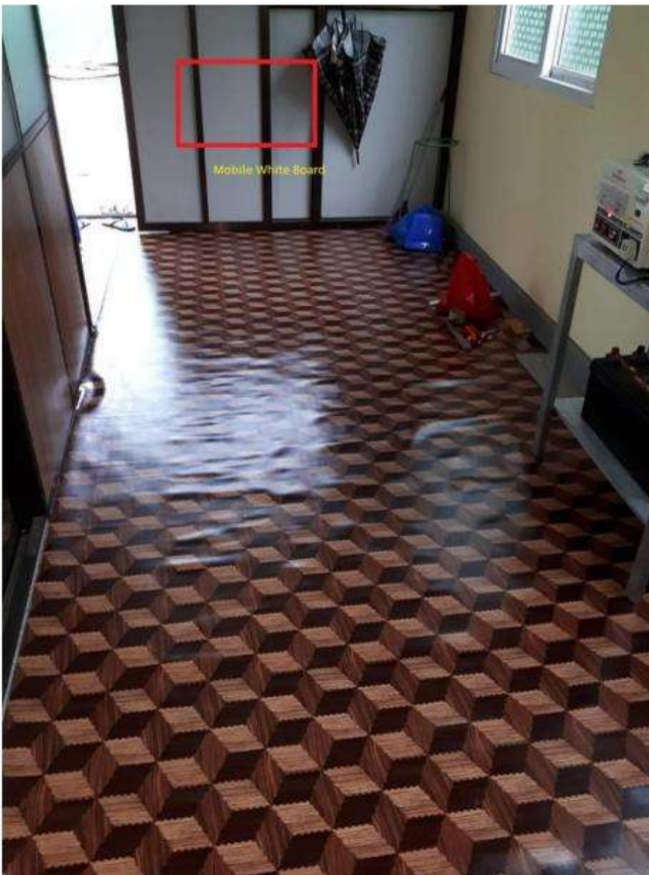
Classroom 3 Downstair (Standby Place)