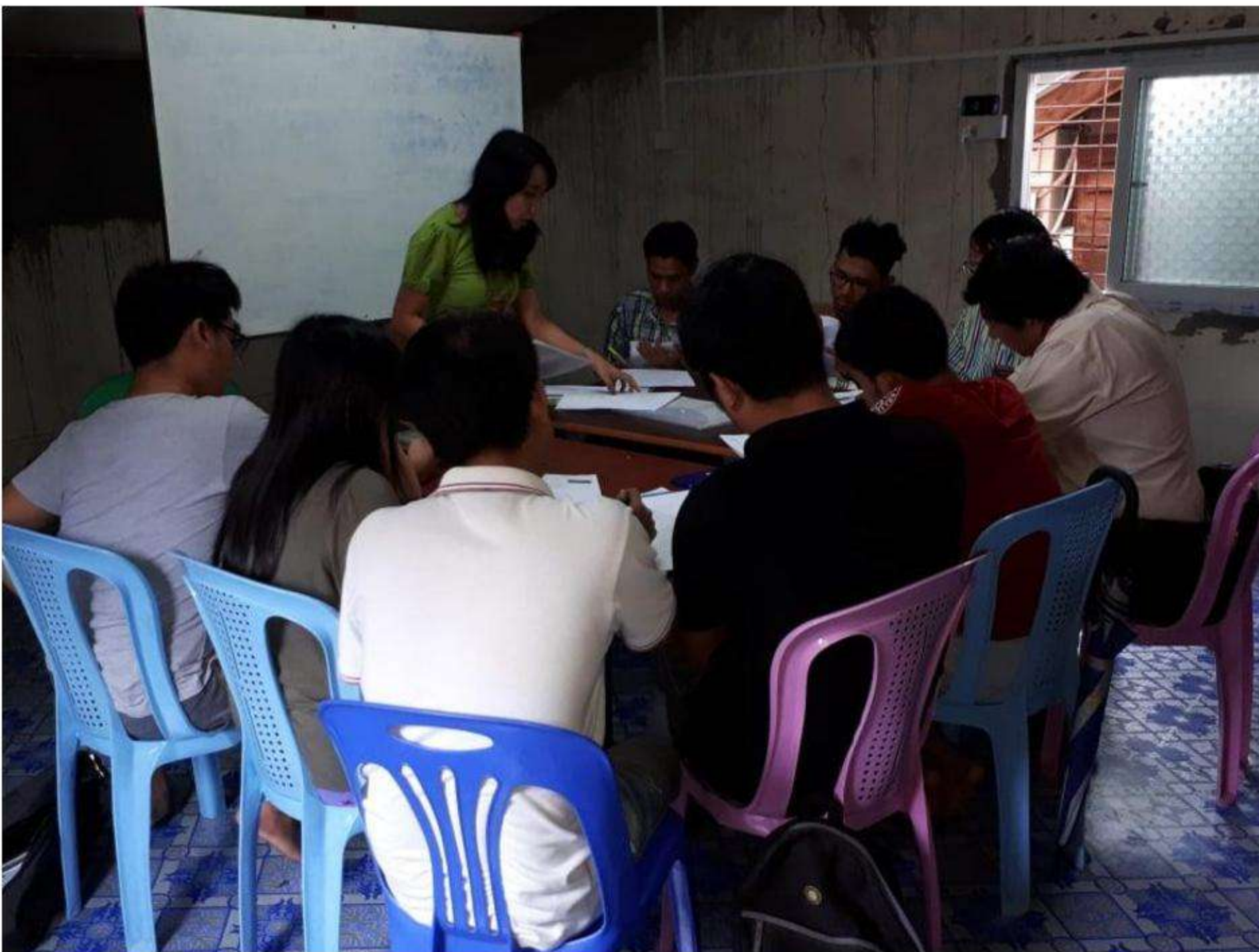
Upstair Classroom 4