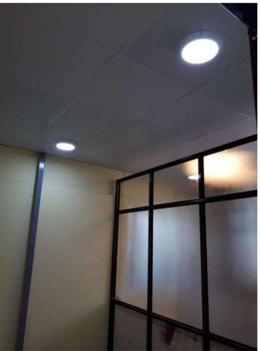
Interior of rooms