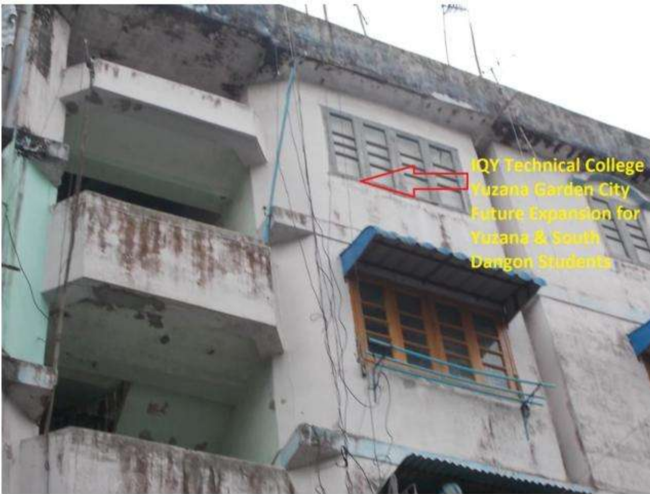
IQY Yuzana Garden City