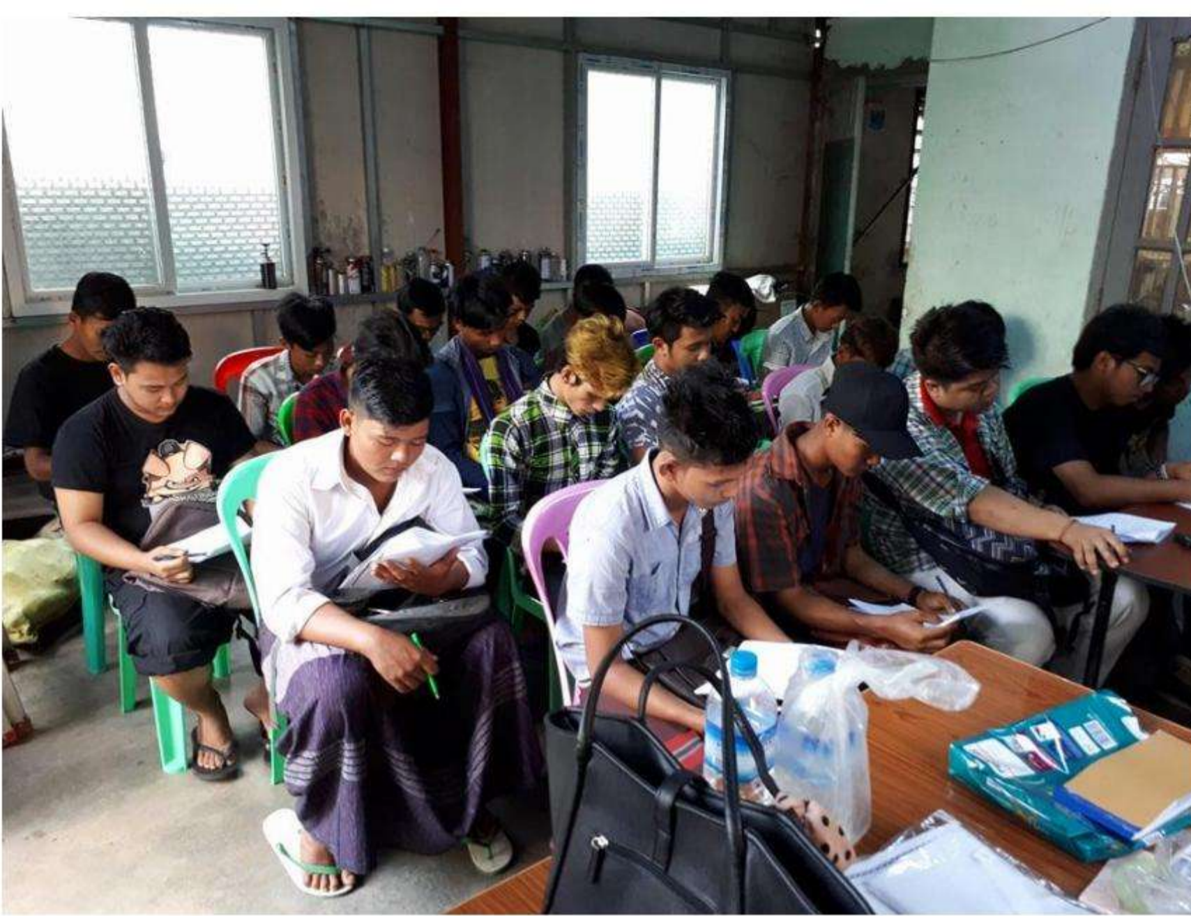
Former IQY Class