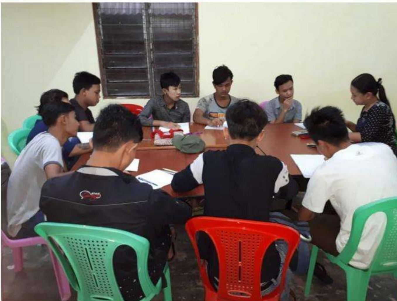
Class 1 Downstair