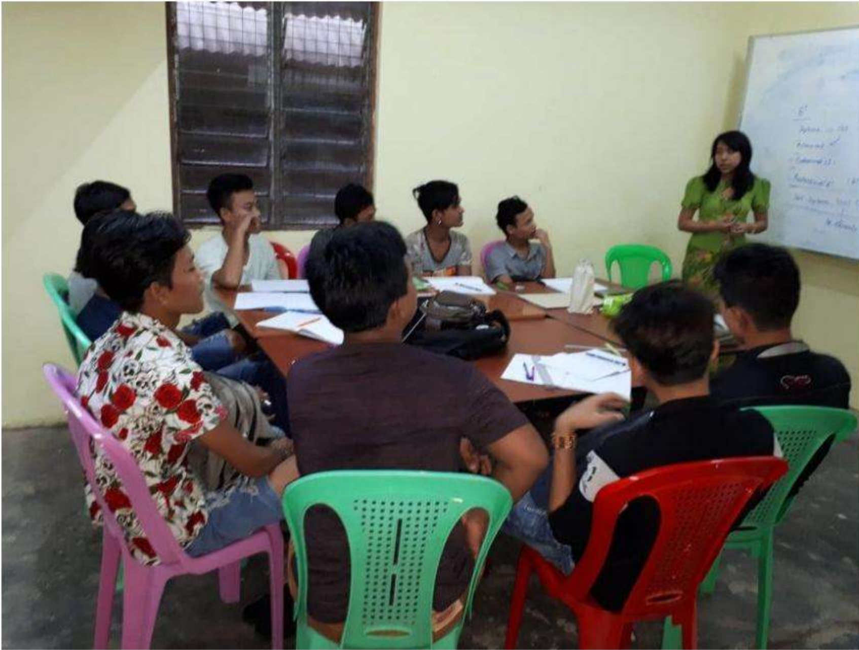
Class 1 Downstair