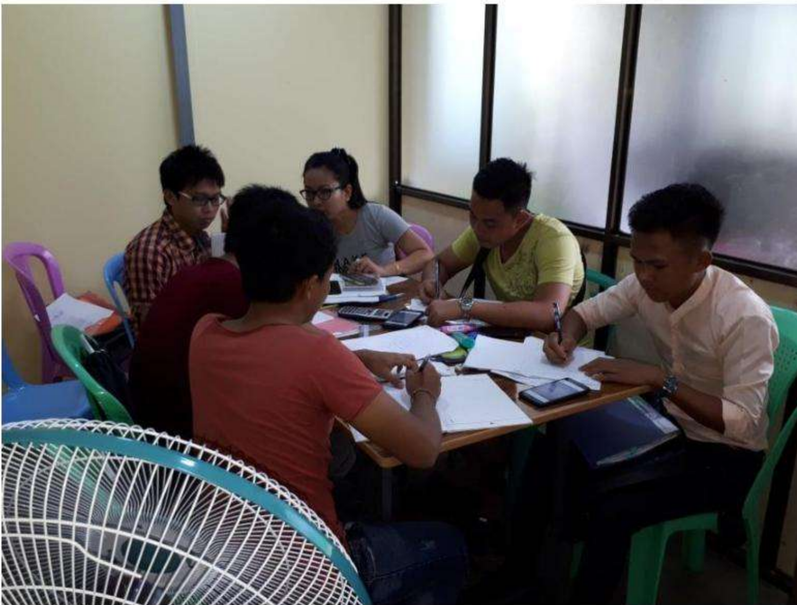
Class 2 Discussion Room (Downstair-Front)