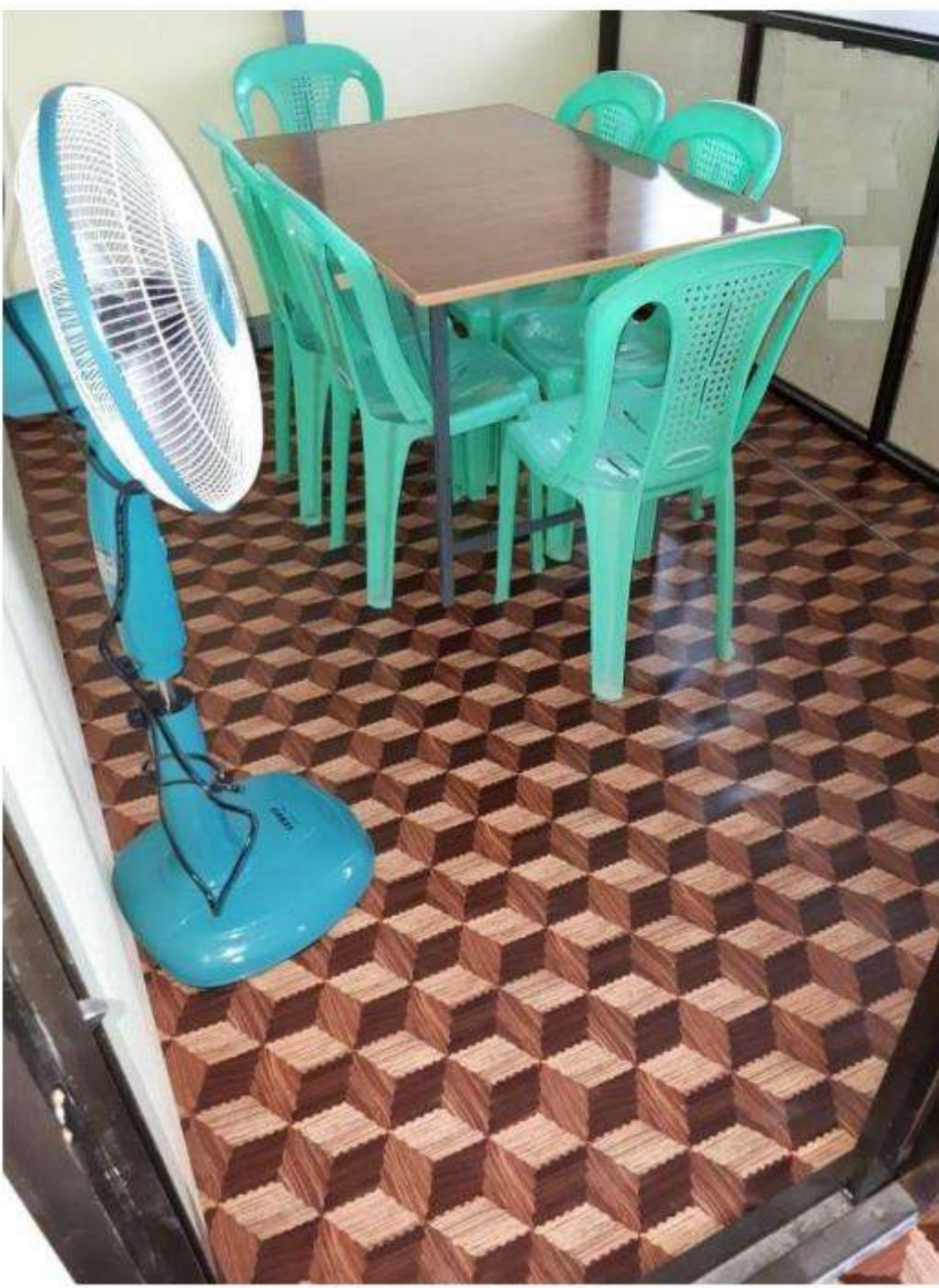
Classroom 2 Downstair Discussion Room