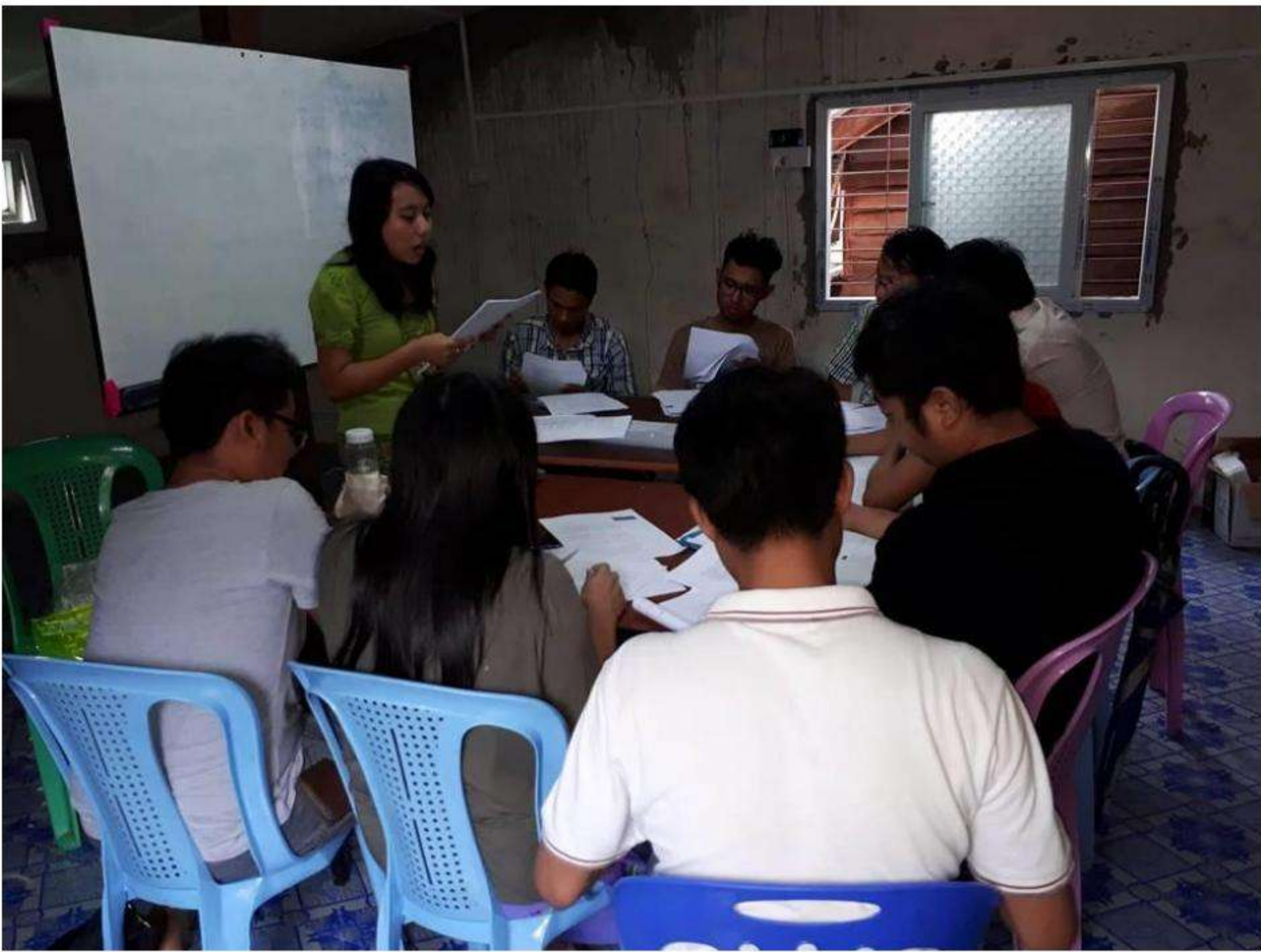
Class 3 Upstair