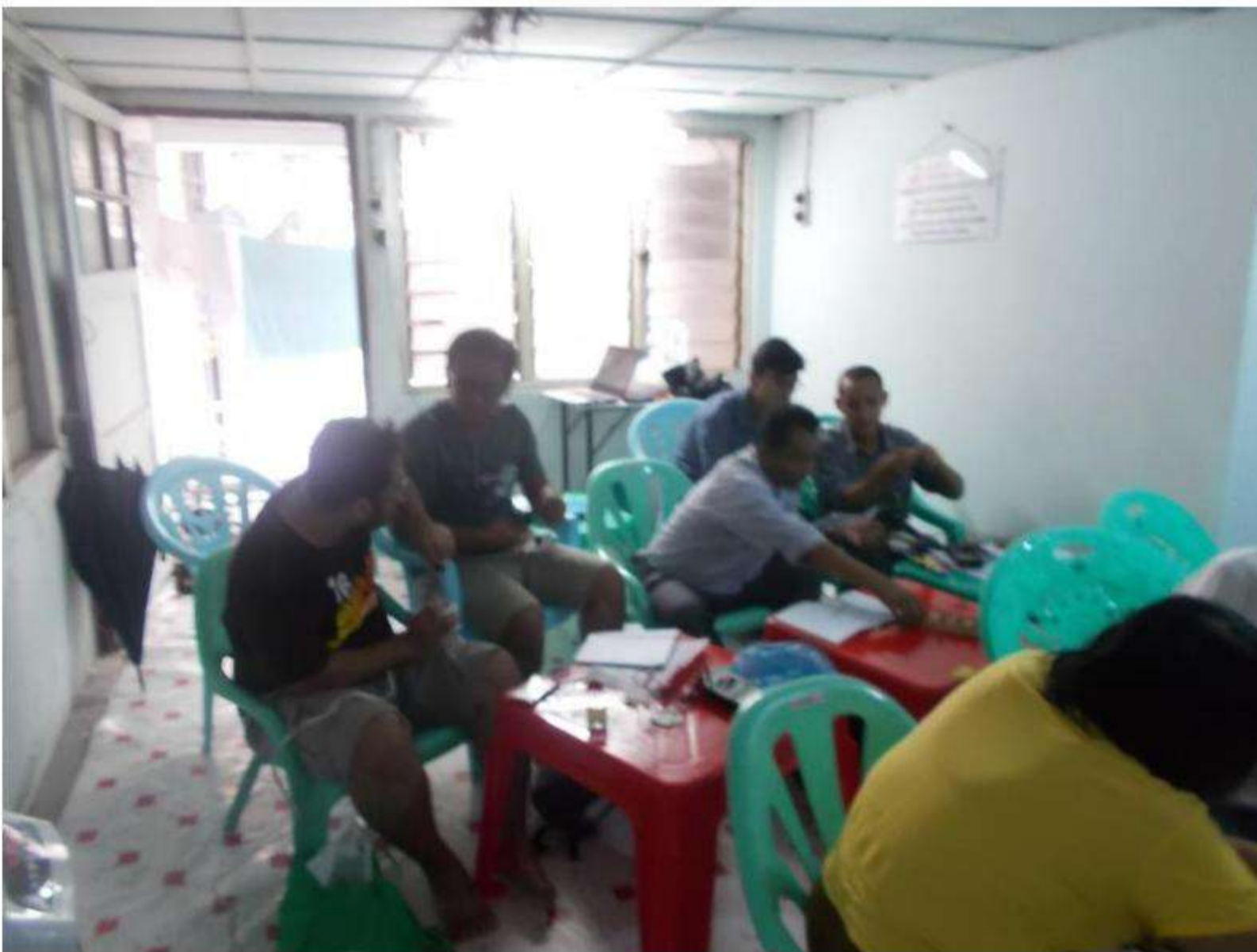
IQY Dagonthiri St Kyauk-myaung, Tarmwe