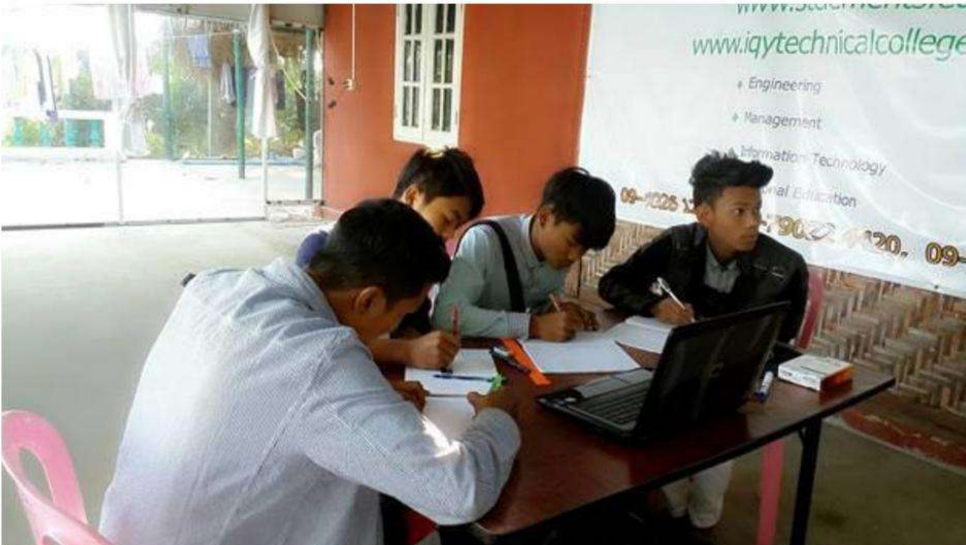
IQY Mandalay Teaching Session