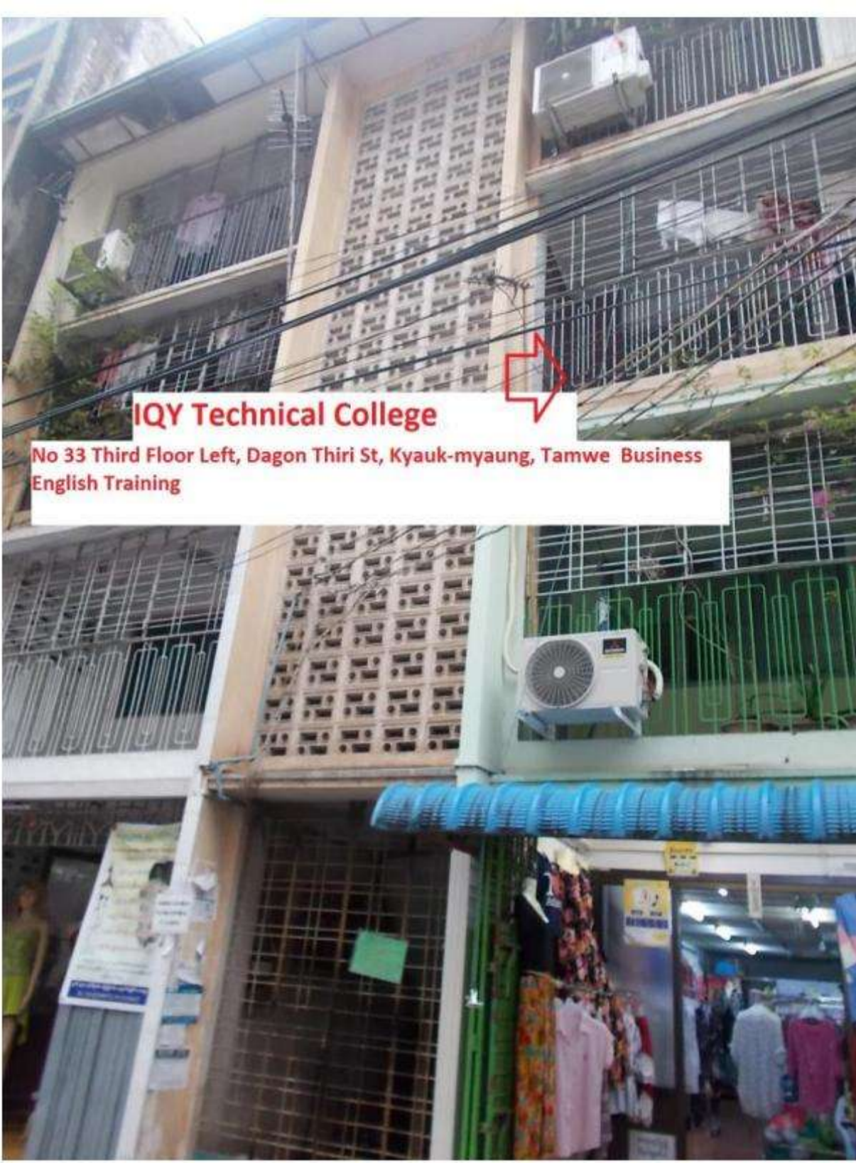
IQY Dagonthiri St Kyauk-myaung, Tarmwe