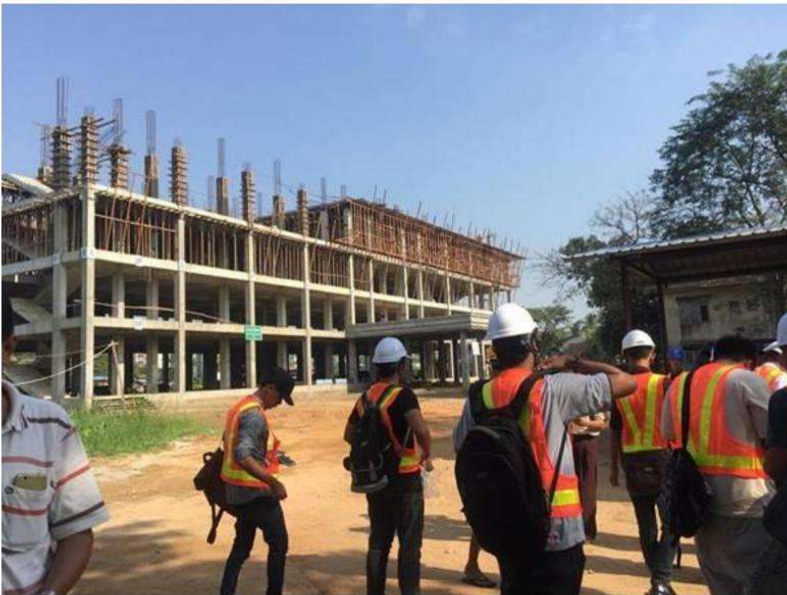
IQY Technical College Venues