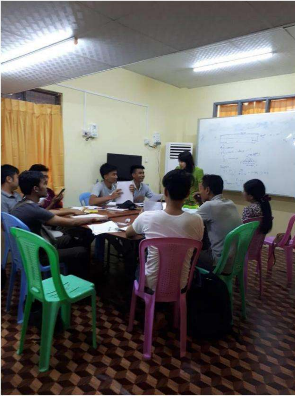
Class 1 Downstair