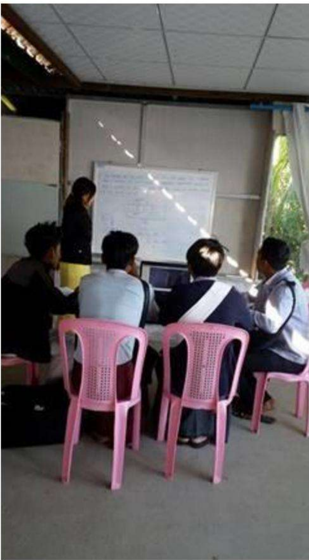
IQY Mandalay Teaching Session