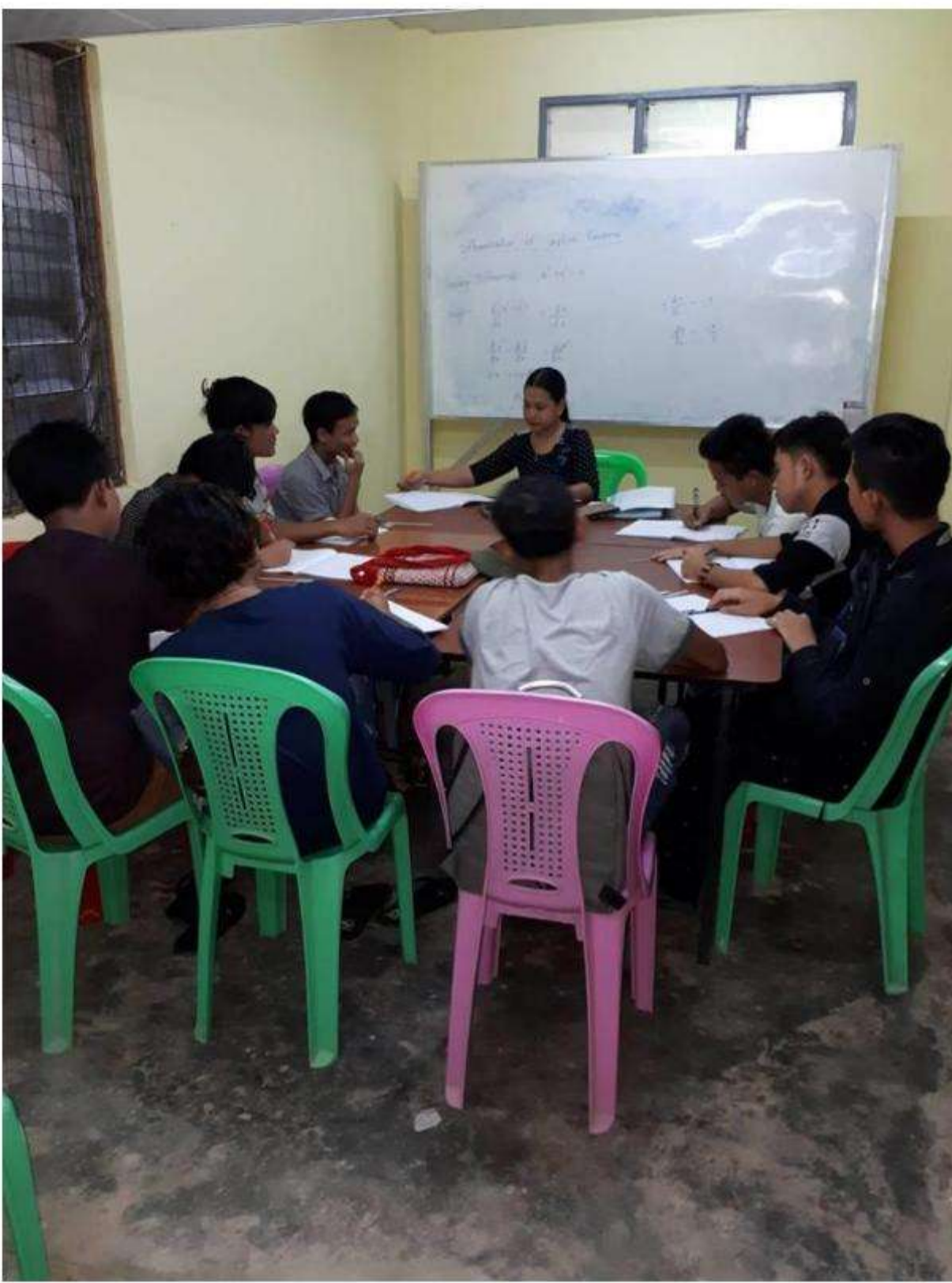
Class 1 Downstair