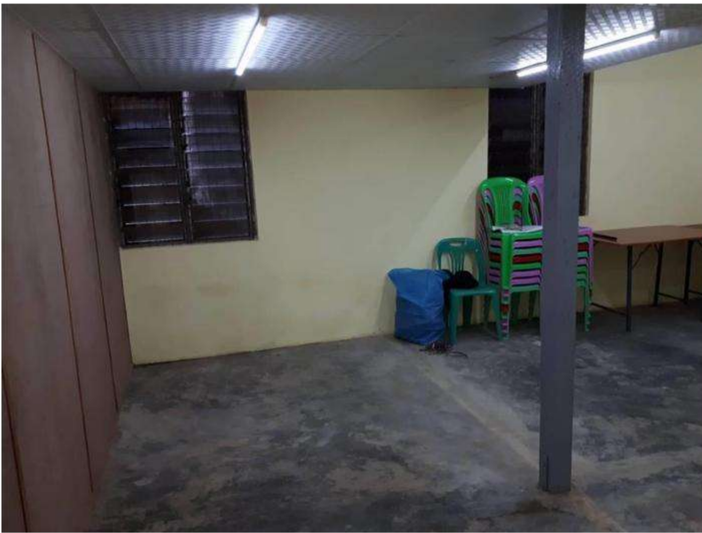
Classroom (1) Downstair