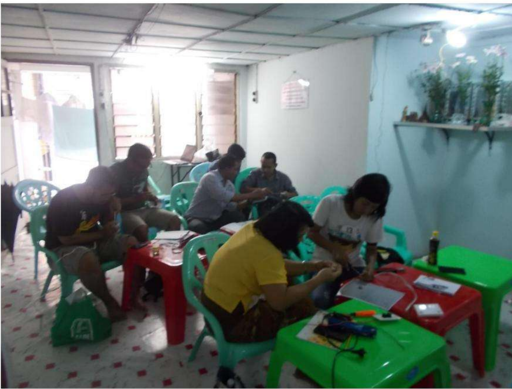
IQY Dagonthiri St Kyauk-myaung, Tarmwe