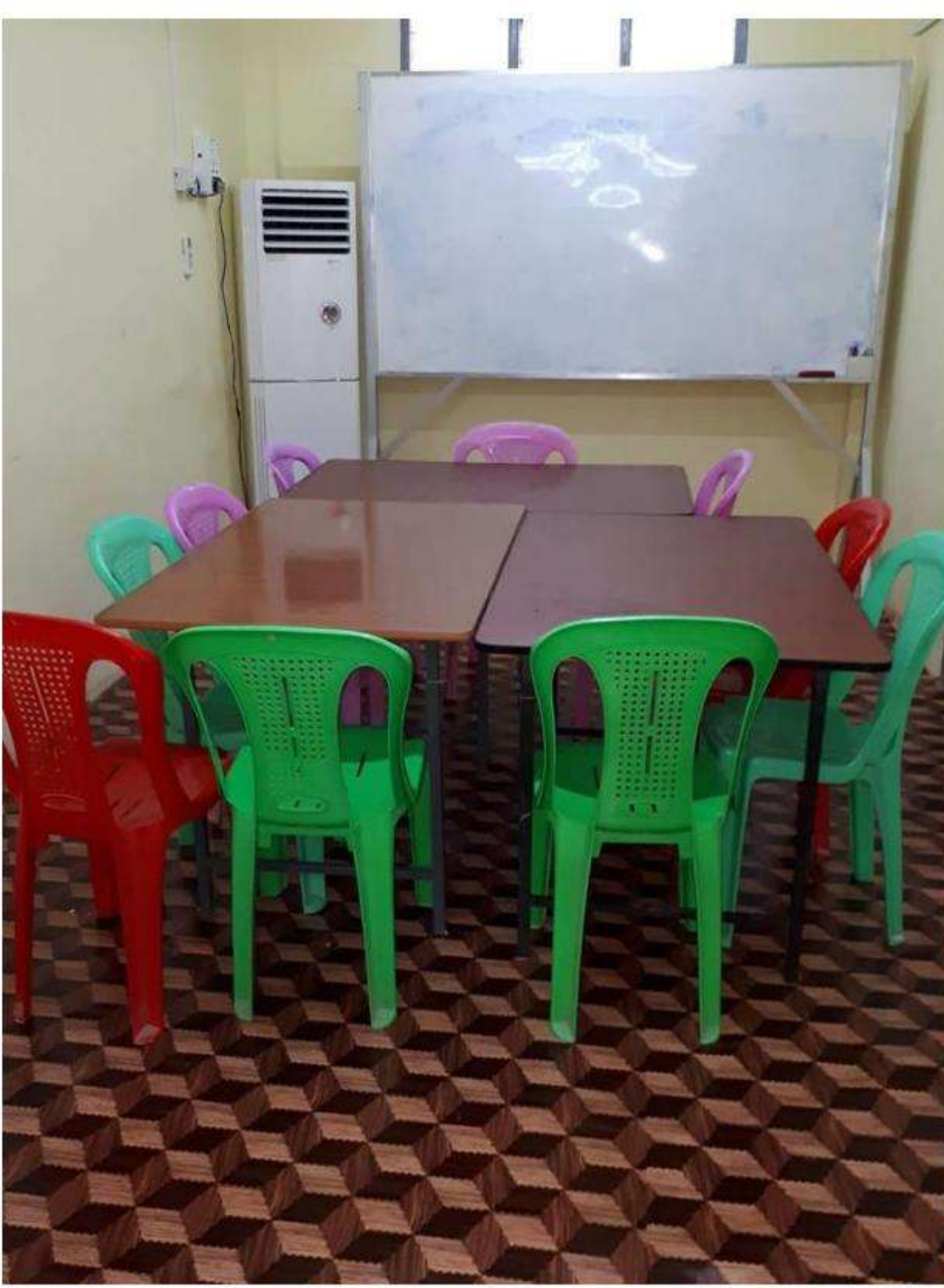
Classroom (1A/B) Downstair