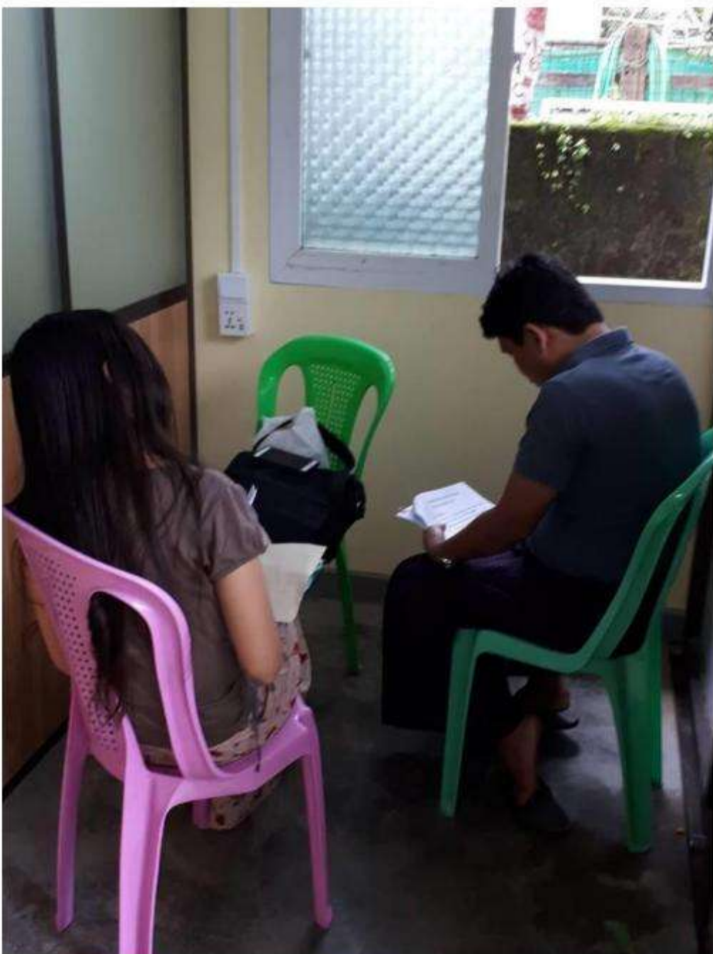
Reception+ Individual Consultation Place