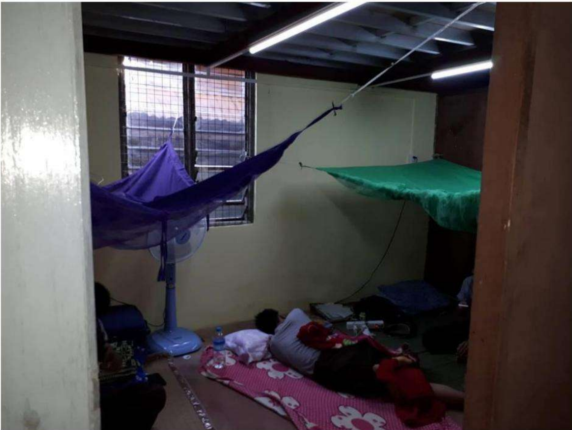
Students Hostel (Downstair bedroom)