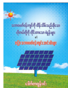
သဘာဝတရားကျင့်စဉ်ကို

ကျွန်တို့အား ဝန်ထမ်း App တွင် ဆက်စပ်မည့်