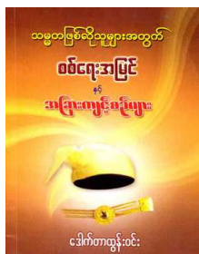
ဝစ်ရေးအမြင်နှင့်

Like Share Sign Up to see what your friends like.